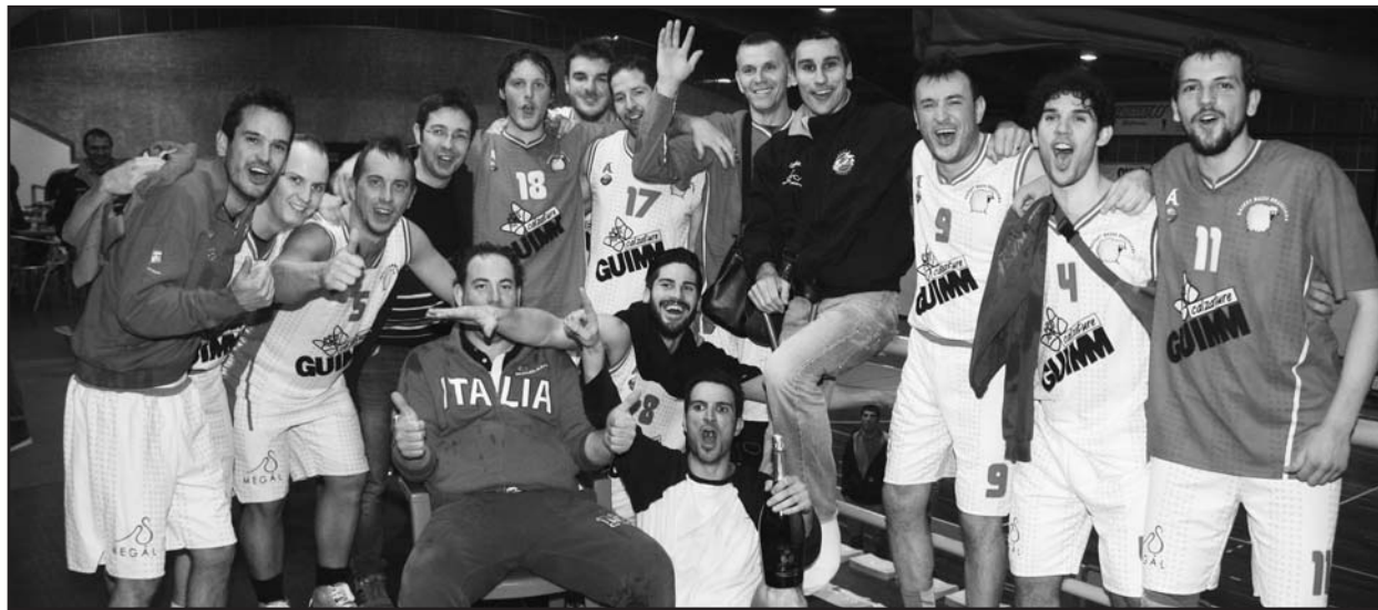
Foto di gruppo a ricordo di un campionato memorabile.