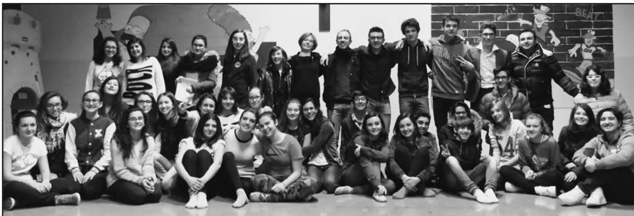
I ragazzi protagonisti del musical.