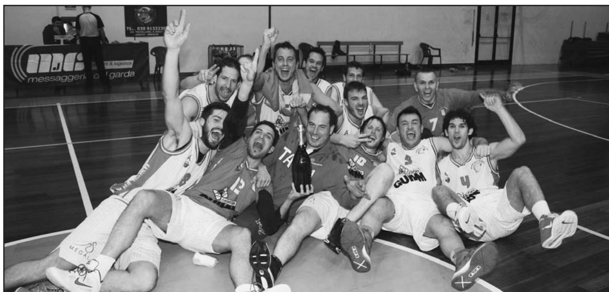
Euforia al termine della gara che ha sentenziato la vittoria del campionato.