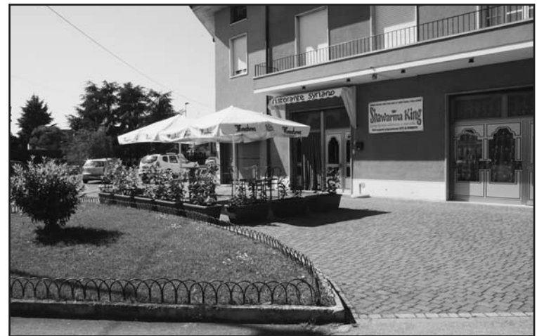
Ampi spazi all'aperto per una ristorazione estiva.

PIATTI PER VEGETARIANI E VEGANI DOLCI TIPICI SIRIANI E VEGANI