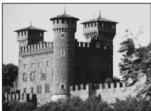
Il Castello: "il centro fiera" del Centro Storico di Montichiari.

"Il nostro è un gruppo che si sta impegnando a fondo per un progetto di rilancio complessivo di Montichiari, convinti come siamo che il territorio in cui viviamo abbia le carte in regola per diventare punto di riferimento per lo sviluppo di un'area molto vasta. Abbiamo infrastrutture che meritano la dovuta attenzione e che devono essere adeguatamente valorizzate: pensiamo per esempio al polo fieristico, all'aeroporto, all'ospedale. All'interno della coalizione che sostiene Mario Fraccaro, la nostra lista vuole essere un vero e proprio motore dedicato a promuovere il territorio, liberando energie e risorse in campo culturale e turistico e valorizzando le tipicità presenti. Abbiamo all'orizzonte opportunità uniche quali EXPO 2015 ed è assurdo che la classe dirigente locale non