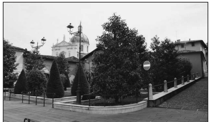
Un bel colpo d'occhio, però inutile per le esigenze del paese.