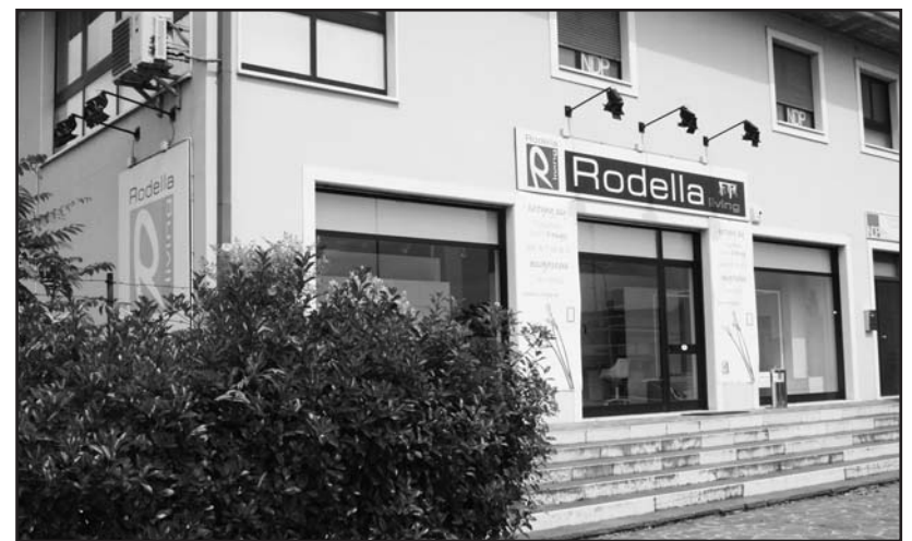
La sede in via Brescia 120 a Montichiari.